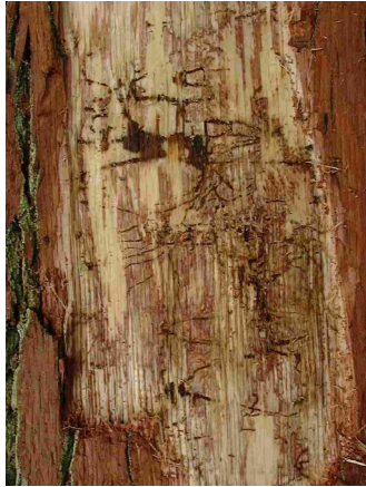
Bild 3: Herdförmiger Fraß junger Larven in noch grünem Bast

Die jungen Larven fressen dunkle, treppen- oder zick-zack-förmige Gänge in den noch grünen Bast, meist in Herden aus 3-6 Einzelgängen, entsprechend der überlebenden Brut eines Eigeleges. Im Spät-